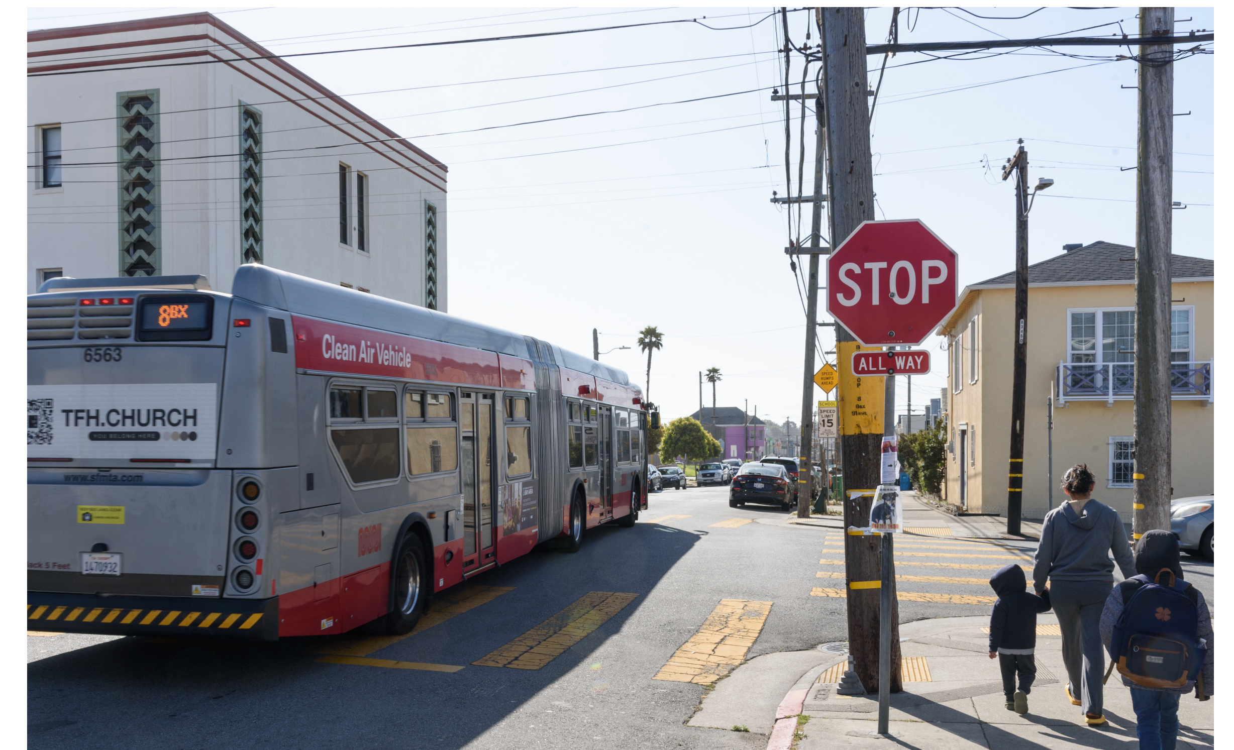
Hành khách tại một trạm dừng 8 Bayshore trên đường Visitacion Avenue.