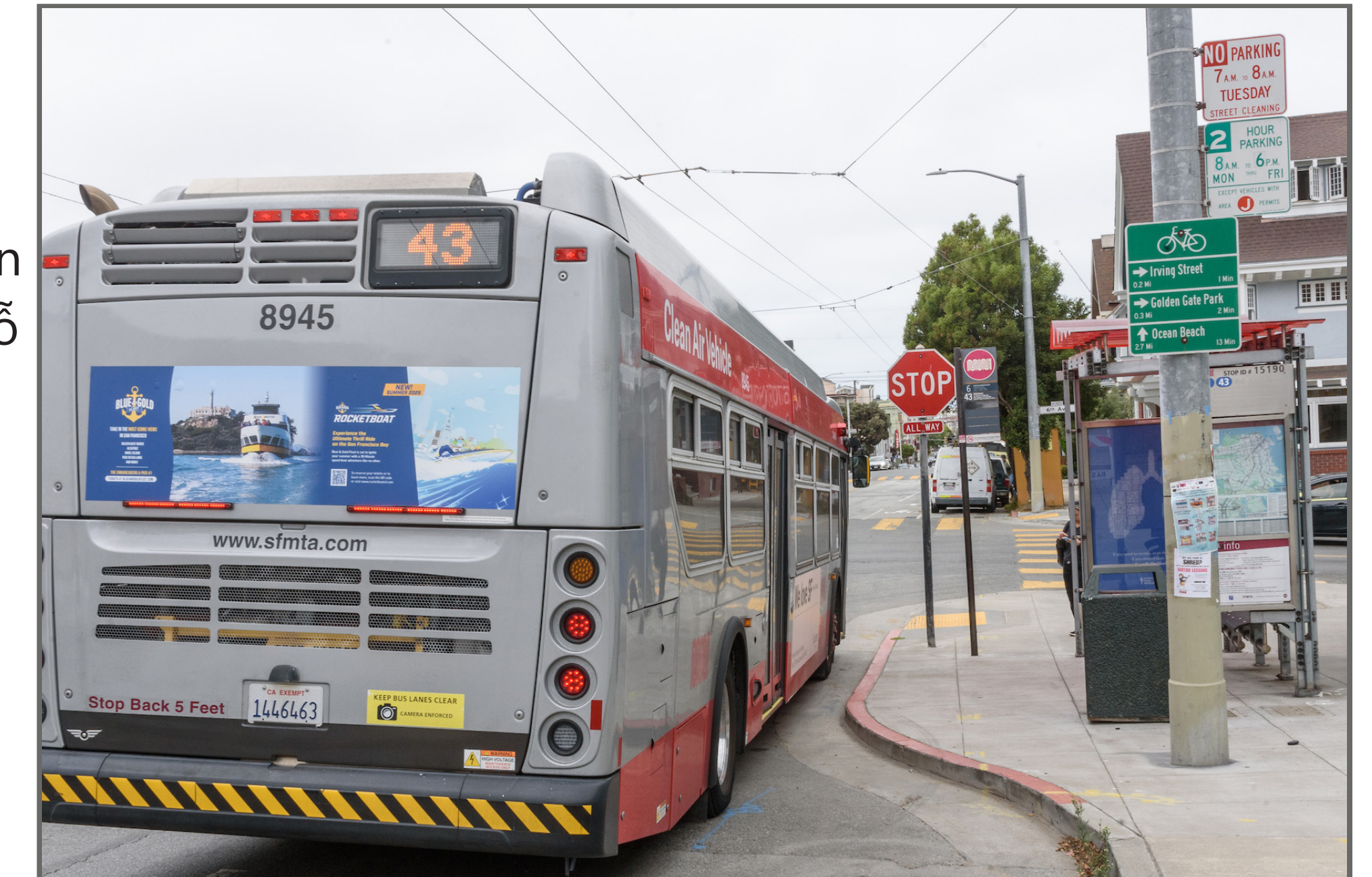
Một xe buýt Muni dừng tại khu mở rộng vỉa hè dành cho xe buýt.

Dự án này sẽ xây dựng các phần mở rộng dành cho xe buýt ở "cửa trước", tức là ngắn hơn các phần mở rộng thông thường có chiều dài bằng cả chiếc xe buýt. Điều này có nghĩa là sẽ cần phải bỏ đi ít chỗ đậu xe hơn. Tổng cộng sẽ phải bỏ đi một chỗ đậu xe cho mỗi trạm dừng trong bảy trạm dừng.