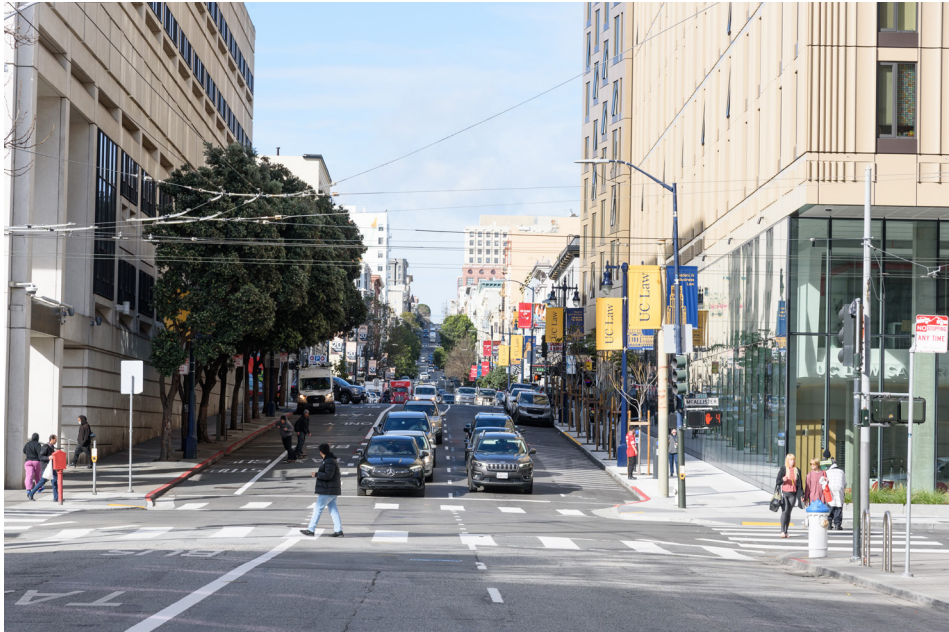
Hyde Street ejemplo con reducción de un carril y carril de autobus/taxi

Las calles del Tenderloin se encuentran dentro de la Red de Alto Riesgo de Lesiones de San Francisco, que abarca el 12 % de las calles donde han ocurrido el 68 % de las colisiones con personas lesionadas en los últimos 5 años. El Proyecto de Construcción Rápida de Larkin se agrega a las mejoras de seguridad peatonal que se han implementado en todo el barrio. El proyecto incluirá una reducción de carriles entre las calles Market y Sutter, mejorará la fiabilidad del transporte público y revisará la condición de los bordillos. También se coordinará con el proyecto de pavimentación de la primavera de 2025 y el Proyecto de Mejora de Señales de Tráfico de Tenderloin.