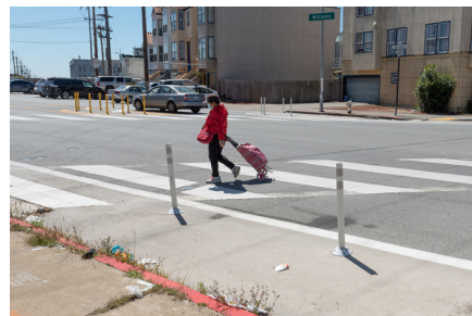
Pininturahang Sonang Pangkaligtasan