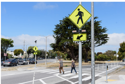
Parihabang Kumikislap na Ilaw