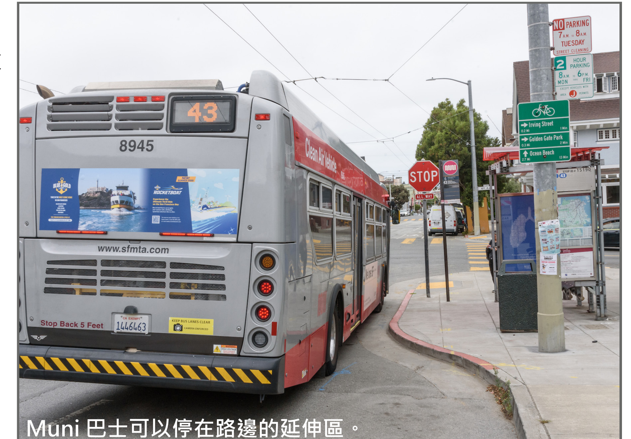
Muni 巴士可以停在路邊的延伸區。

本專案將建設「前門型」候車道擴展區，其長度比一般全長候車道擴展區更短。這表示需要取消的停車位較少。在七個站點中，每個站點將各取消一個停車位。