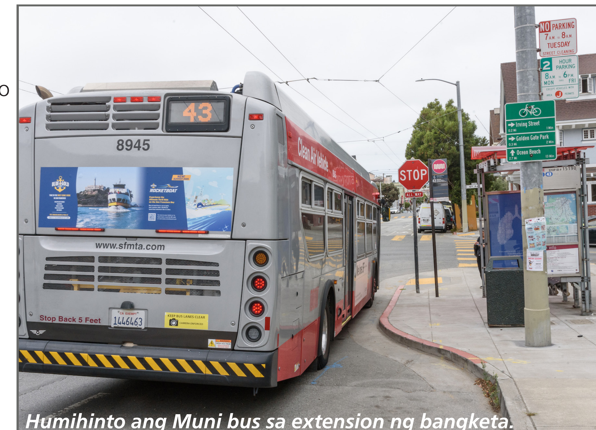
Humihinto ang Muni bus sa extension ng bangketa.

Ang proyektong ito ay magpapatayo ng mga “front-door” bulb, na mas maikli kaysa sa mga karaniwang bus bulb na buo ang haba. Ito ay nangangahulugan ng mas kaunting espasyong paradahan ang kakailanganing alisin. Isang espasyong paradahan kada hintuan ang aalisin sa pitong hintuan sa kabuuan.